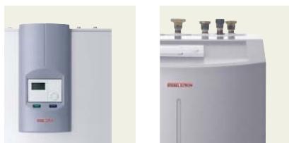
Tepelné čerpadlá WPC | WPC cool a WPF čerpajú svoju silu zo zeme.

Použitie s tepelnými čerpadlami WPF a WPC | WPC cool